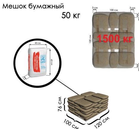
Количество мешков на поддоне - 30 шт.

Вследствие наличия многочисленных факторов, влияющих на результат, информация не подразумевает юридической ответственности.