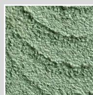
Фр. 1,5-2,0 Фигурный валик